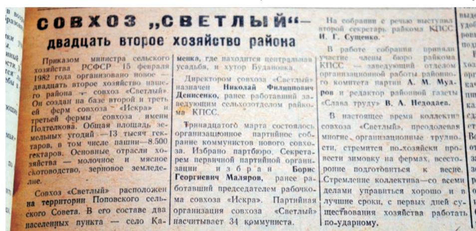
В газете "Слава труду" от 18.03.1982 г. появилась статья о новом хозяйстве.

На общем собрании было принято решение о создании коллективно-совместной формы собственности на землю с распределением долевого пая на каждого члена трудового коллектива.