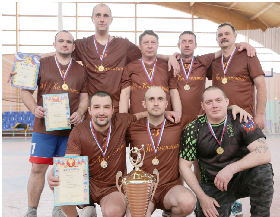
Победитель турнира - "Калининский"

Хорошая новость для любителей волейбола. После двухлетнего перерыва вновь состоялся турнир по этому виду спорта среди команд ГК «Светлый»