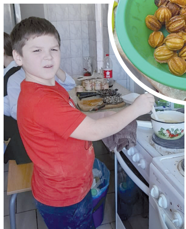
Стараемся для воинов

ли мини-пекарню. Орешки с вкусной начинкой поме- стились в несколь- ких коробках, и получилась вот такая вкусная посылка. А еще дети на- писали пись- ма. Это хоть и детское про- явление за- боты, но все же поддержка для тех, кто в окопах. Казалось бы, ничего особенного не сделали - испекли орешки. Но какую радость испытали дети от совершенного ими доброго дела.