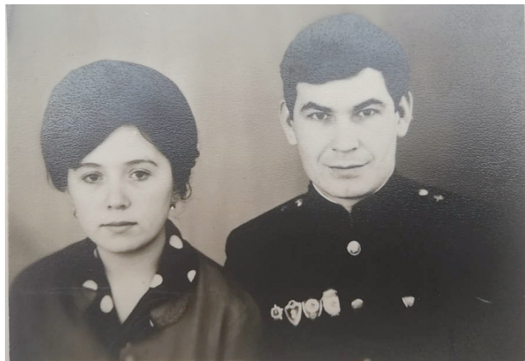
50 лет назад